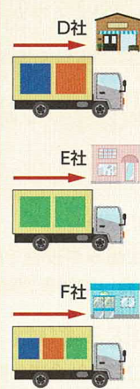
共同配送センター「東京」

船による輸送への切り替え（モーダルシフト）。また、倉庫に到着したトラックが積み卸しの順番を待つ時間を減らすために、あらかじめ倉庫に入る時間を予約するシステムの導入や、積み卸しの時間を短縮するための倉庫作業（荷役）の機械化や標準化も進められています。