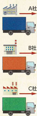
共同配送センター「関西」

そのほか、これまで日本では長い間、スーパーや卸からの受注に対して翌日配送することが慣習となっていました。これを翌々日配送に変えることで荷物をまとめ、トラックの台数を減らして効率を向上させるという取り組みも始まっています。